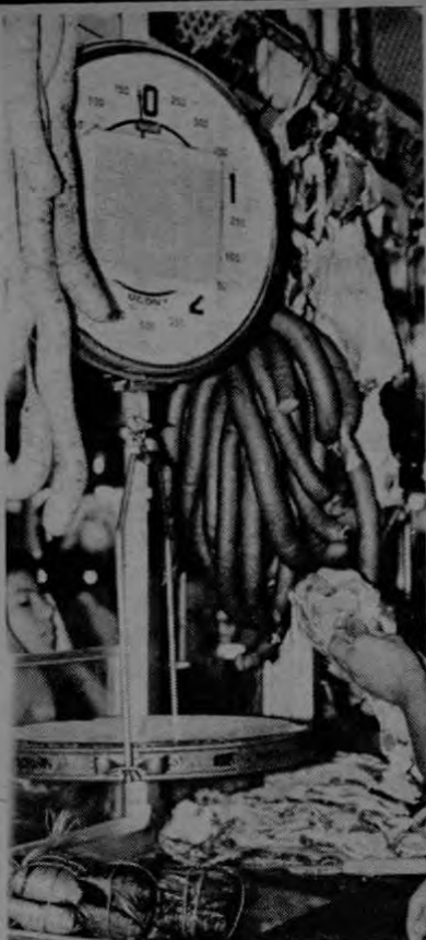
La carne, especialmente la de cerdo, así como sus derivados; el chorizo, el salchichón y las salchichas, están estos días por los aires, y se vislumbra un aumento mayor en los precios después de las elecciones. Si usted no lo creé, visite ahora una carnicería como la de esta gráfica.

Muchos creen que el hecho de que estamos a pocos días de las elecciones han obligado al Partido en el poder, a evitar - por el momento cualquier alza oficial de precios.