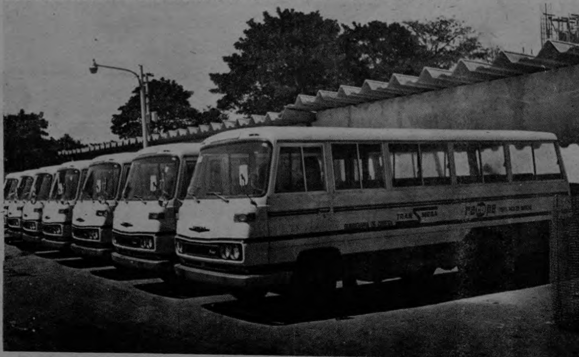
En la gráfica podemos apreciar algunos de los modernos y confortables microbuses, de una flota total de 150, que en breve se incorporarán al servicio de transporte remunerado en el área metropolitana bajo el sistema llamado "Expreso Ejecutivo". Son modernas unidades "Nissan", tipo "Civilian", modelo 1978.