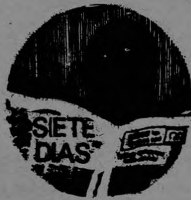
DOMINGO: Goles y Ferrocarril. . .

Francia ha tenido que intervenir para salvar a Mauritania de la bancarrota y el desastre. Es también un aliado fiel del Rey Hassan de Marruecos. Pero, Argelia y otros países africanos han denunciado esta ingerencia y advierten que por este camino se puede desembocar en un nuevo Vietnam.