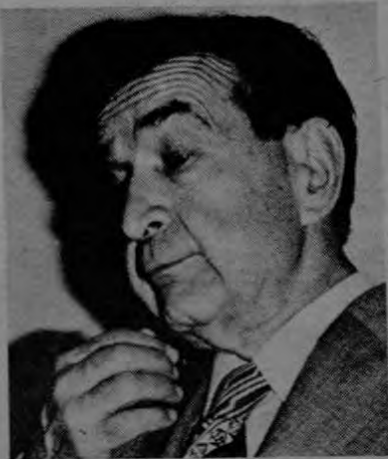
Figueres para que viaje, ya que el exmandatario también tiene su juego.

Algunos sectores del figuerismo, interesados en que don Pepe no continúe apoyando activamente a don Luis Alberto Monge, estarían buscando la forma de aprovechar los problemas en la salud del expresidente para que salga del país. Algunos le estarían aconsejando trasladarse a una clínica en Houston por varios meses, mientras pasa la campaña electoral, según se nos informó en fuentes del LN. Es sabido que algunos connotados figueristas ahora están con Carazo, incluso un médico muy conocido, que se ha destacado por ser amigo del que tiene más poder en cada momento. Resulta poco probable que esos "figueristas" logren convencer a don Pepe